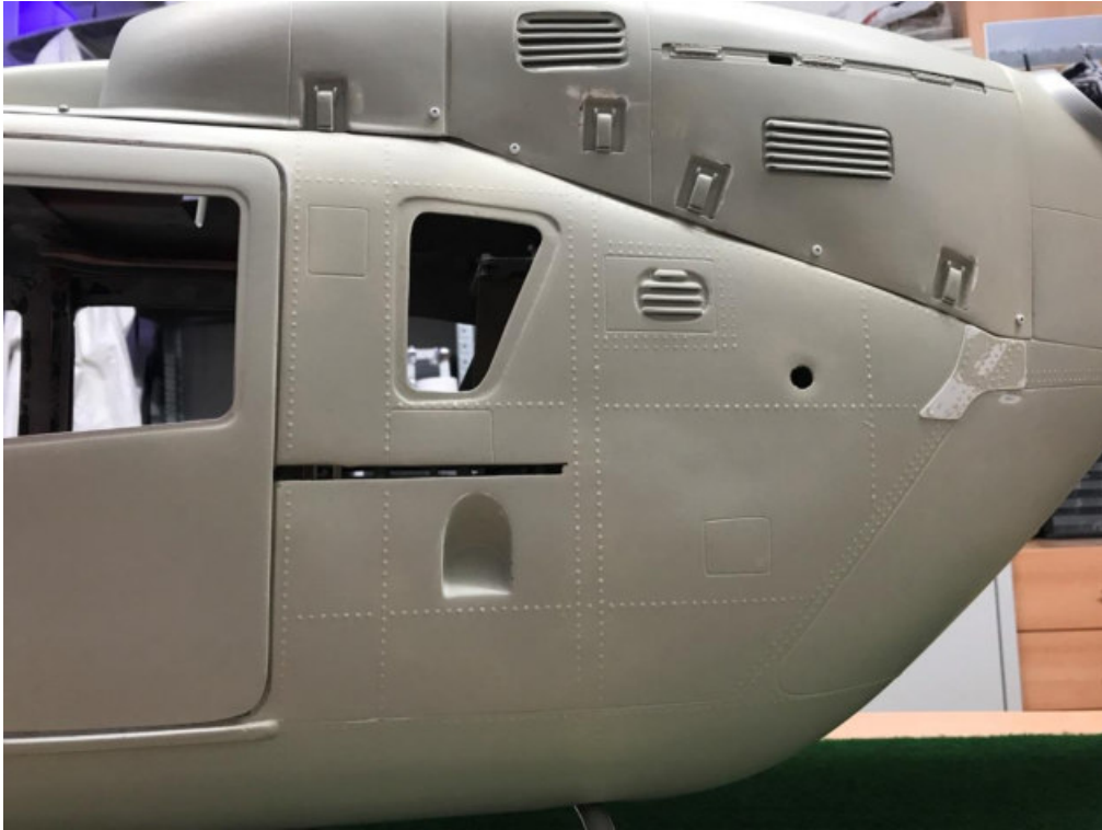
5. Schritt: Service an der Mechanik